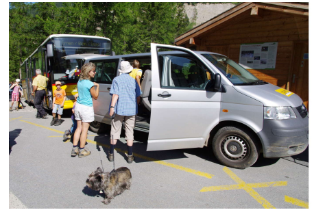
Des transports publics très bien organisés dans le Binntal