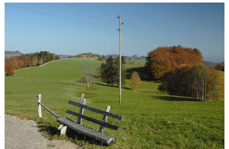
Farniente et randonnée dans le Parc naturel régional Thal