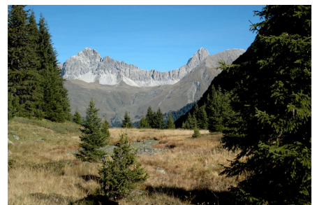
Des montagnes à couper le souffle sur l'Alp Flix