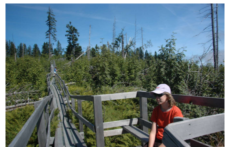
Découvrir le sentier du Gägger dans la forêt du Gantrisch