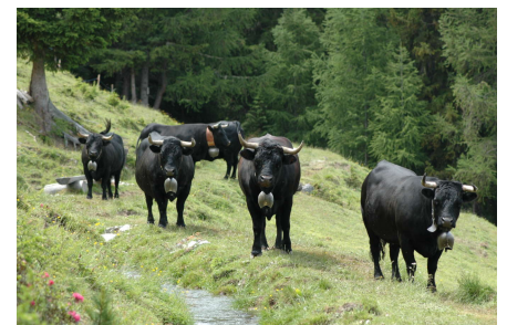
Cheminer avec les célèbres bêtes à cornes sur la Moosalp